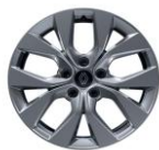
Jante aliaj 17" (RALU17/RDIF15)