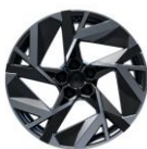
Jante aliaj 19", design esprit Alpine (RALU19/RDIF16)