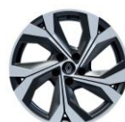
Jante aliaj 18" (RALU18/RDIF12)