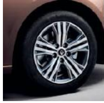
Jante aliaj 16", design diamantat Impulse