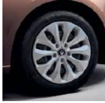
Jante otel 16", design Florida