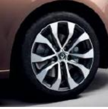
Jante aliaj 17" design Allium